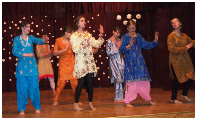
7a mergaitės šoko indišką šoki

Parengė Samanta RIMKUTĖ ir Monika JASINSKAITĖ