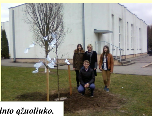
Prie pasodinto ažuoliuko.